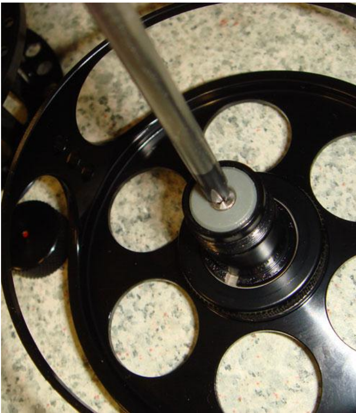
7. Ruuvaa ruuvi takaisin