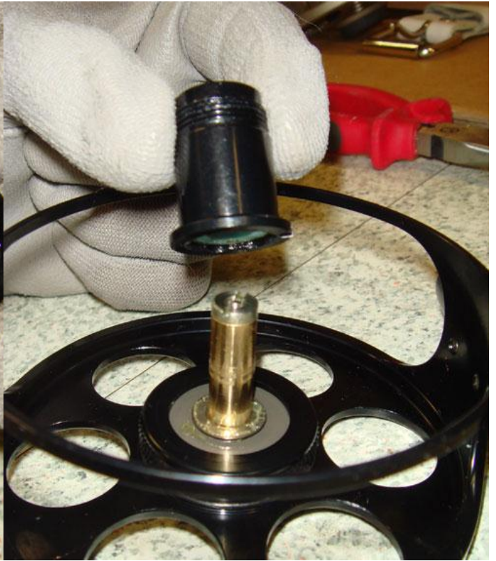
6. Laita laakeri toisin päin takaisin