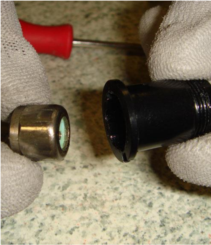
5. Ravista yksisuuntalaaketi ulos laakerikupista